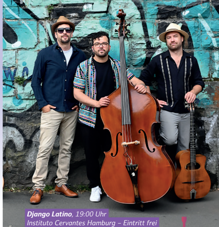
Django Latino, 19:00 Uhr Instituto Cervantes Hamburg – Eintritt frei

Das Generalkonsulat der Ukraine bietet Experten-Vorlesungen, Filmvorstellungen sowie VR-Erlebnisse und informiert so über die Geschichte, Kultur und die aktuelle Situation in der Ukraine. Von 16:00 bis 17:00 Uhr wird es ein Extra-Programm für Kinder geben. 16:00 bis 20:00 Uhr